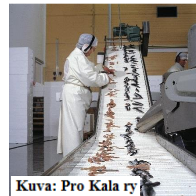
Kuva: Pro Kala ry